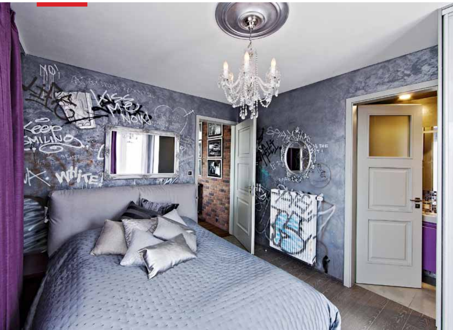
▲ Nejvýraznějším prvkem interiéru jsou graffiti, které zde vytvořil Lukáš Kladívko, kamarád designérky Dory Vejmelkové