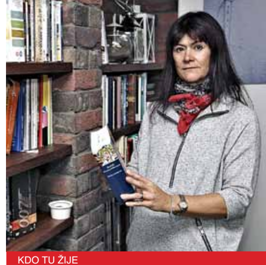
KDO TU ŽIJE

▲ Autorkou fotografií rozvěšených po stěnách je Dana Wedenig